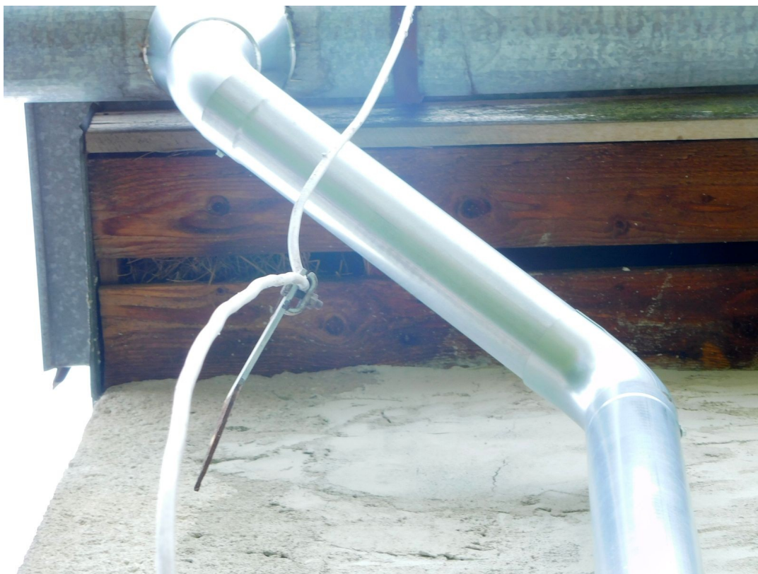
Obr. 3 Hniezdny materiál pod štablónom budovy prifahlej plavárne