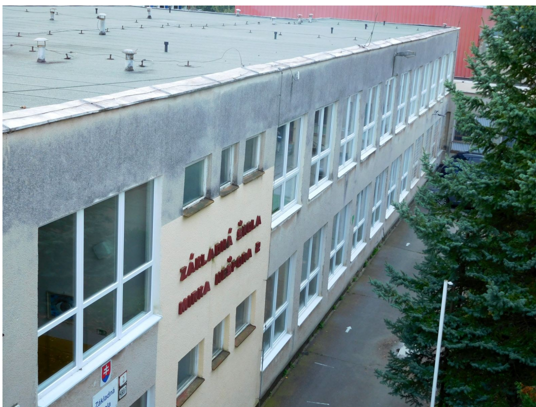
Obr. 2 Celkový pohľad na budovu – severná stena