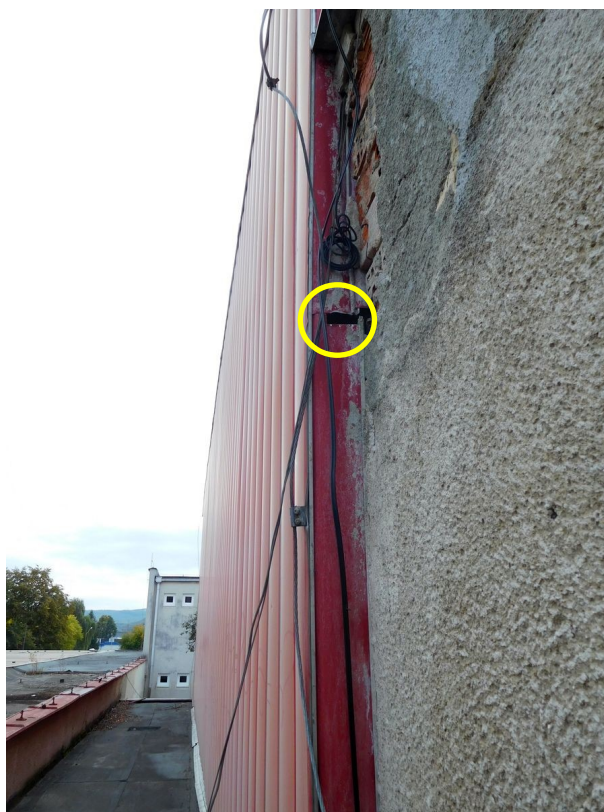
Obr. 4 Štrbina, ktorá môže slúžiť ako vletový otvor