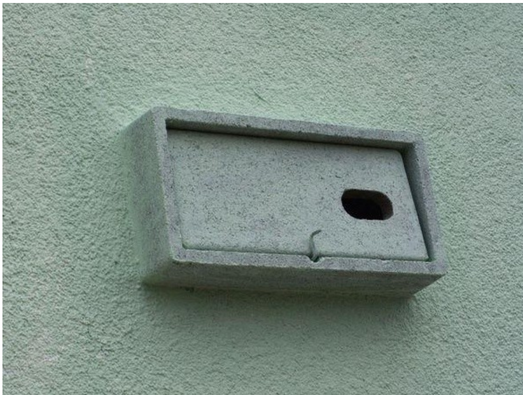
Obr. 6 Ukážka búbky APK-1 inštalovanej v izolante