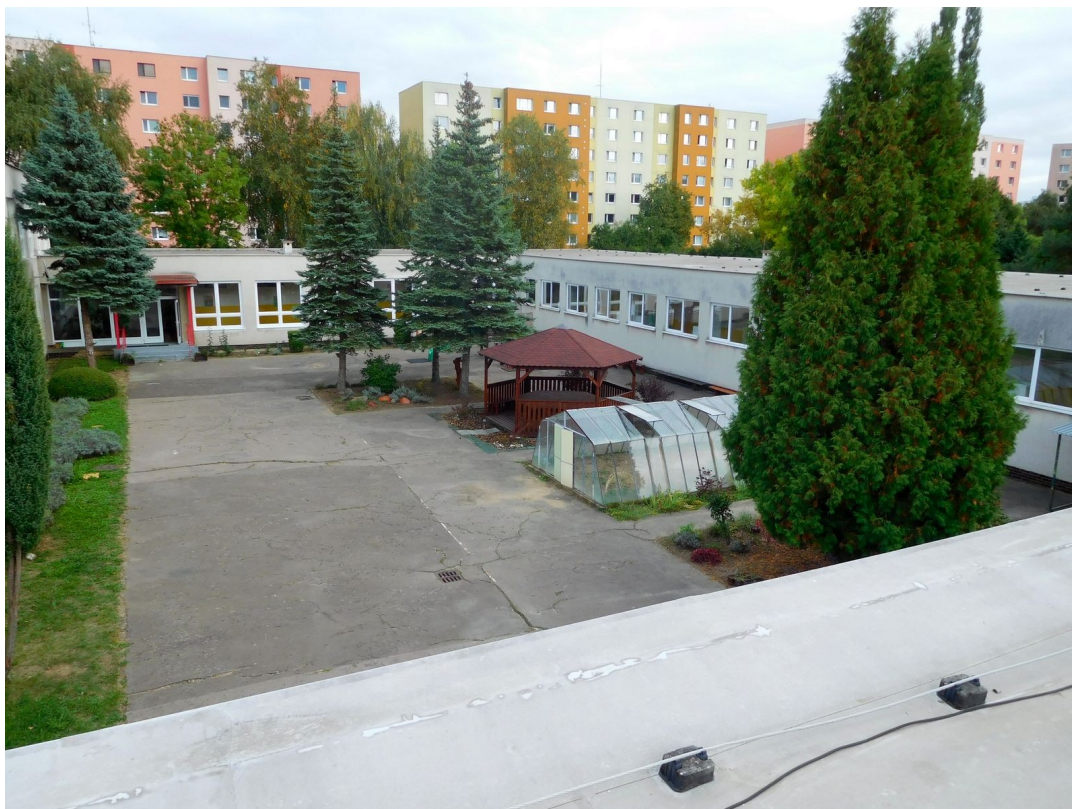
Obr. 1 Celkový pohľad na budovu – zo strechy smerom do átria