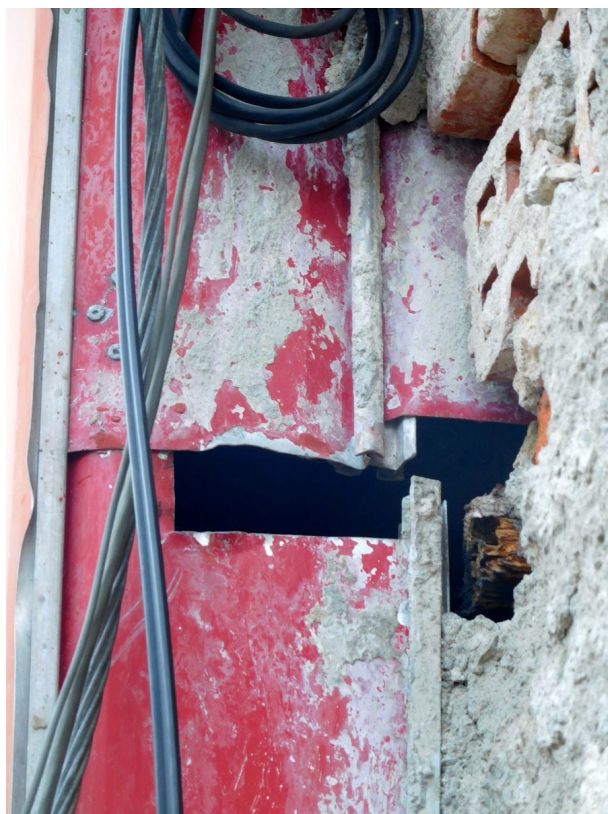
Obr. 5 Detailný pohľad na štrbinu v obklade